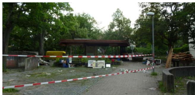
Abbruch des Kiosks Juli 2012, der erste Schritt zur Erneuerung

Das Projekt wurde durch das Garten-, Friedhofs- und Forstamt realisiert und mit rund 300 000 Euro aus den Fördermitteln der Sozialen Stadt finanziert. Der Bund und das Land tragen dabei 60 Prozent der Gesamtkosten.