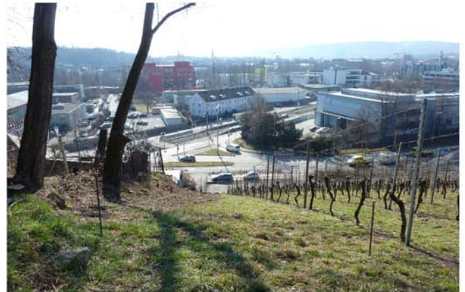
Dieser steile Hang ist jetzt mit der Treppe die erste direkte Wegeverbindung zur U-Bahn Haltestelle Kraftwerk - hier vor dem Baubeginn

Die Baumaßnahme ist eine Kooperation des Tiefbauamtes und des Amtes für Stadtplanung und Stadterneuerung. Die Gesamtkosten von rund 210.000 € wurden im Förderprogramm „Stadtteile mit besonderem Entwicklungsbedarf – Die Soziale Stadt“ finanziert. Der Bund und das Land Baden-Württemberg tragen davon 60 Prozent bei.